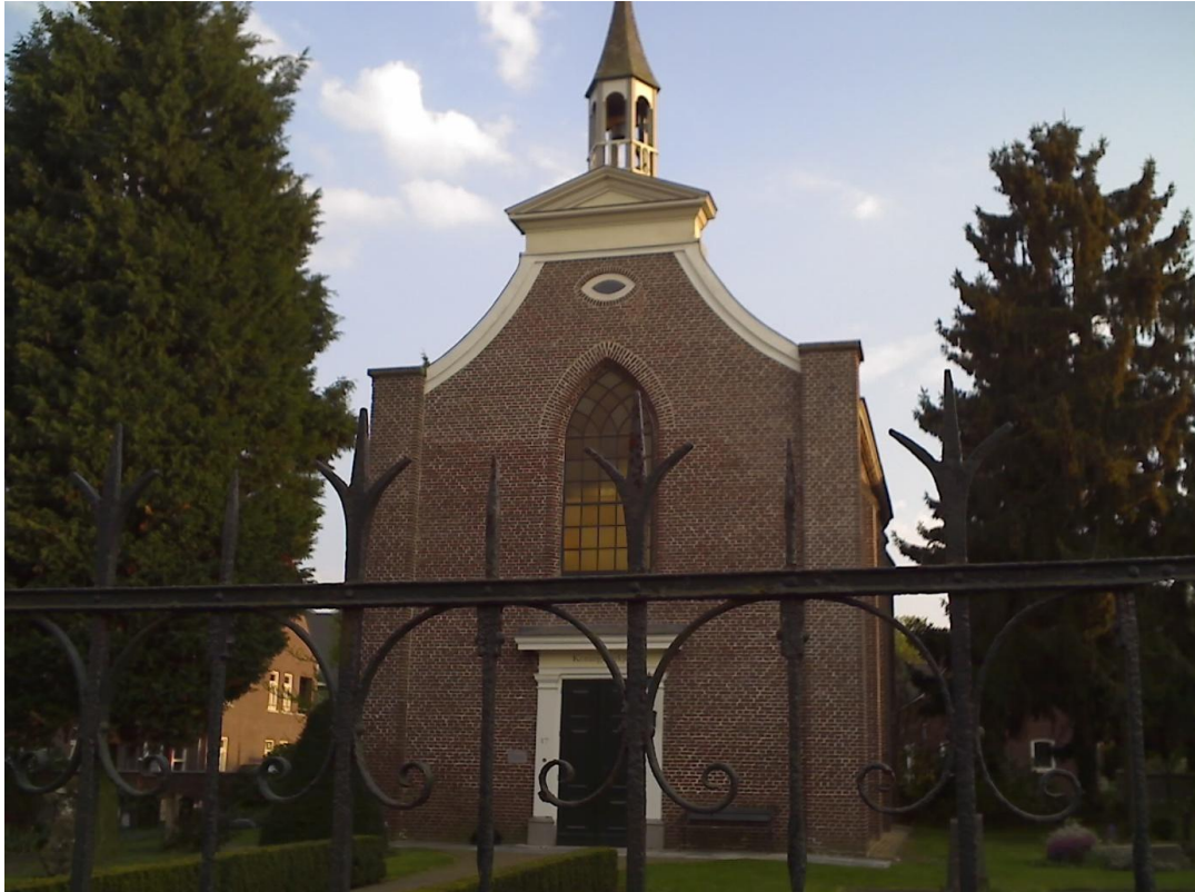
Het Koningskerkje in Vierlingsbeek