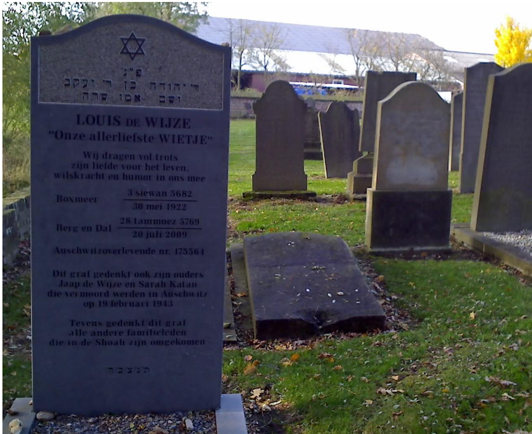
Foto van de Joodse begraafplaats in Vierlingsbeek

Na ons bezoek aan de Joodse begraafplaats liepen we door naar het Koningskerkje, omdat we onze Zuid-Afrikaanse gast dit oude oer-Hollandse - nauwelijks meer in gebruik zijnde - echt protestantse kerkje graag wilden tonen.