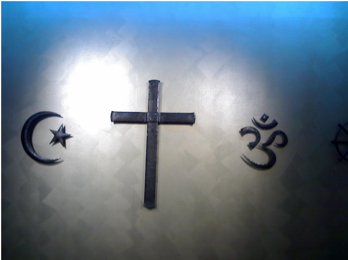
De wand in het stiltecentrum Weijerstate met drie van de symbolen

zijn. Bij de aanbieding van de Bijbel heb ik Psalm131 voorgelezen. Dat is een van de kortste en mooiste Psalmen uit de Bijbel.