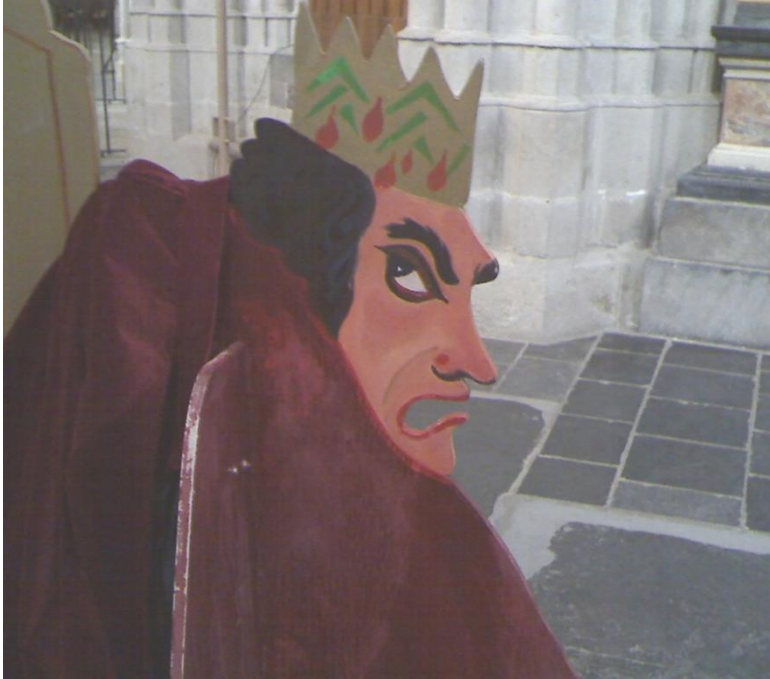
Foto door mij genomen in 2012 in de Kerststal van de Domkerk in Utrecht

Op dit thema heeft Joost van de Vondel een aangrijpend gezicht gemaakt “