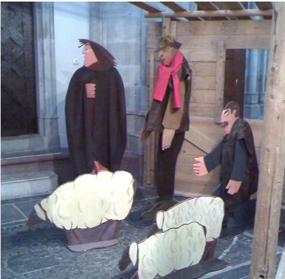
Foto door mij genomen in de Kerststal van de Domkerk in Utrecht

Vandaar dat we in Boxmeer altijd een Gezinsviering hebben op de Kerstochtend, waar het er vrolijk aan toe gaat. Natuurlijk, want we vieren het feest van de geboorte van het kind van Bethlehem. Hoe? Dat jaar wel op een heel bijzondere manier, die ik natuurlijk niet ga verklappen, maar ik ben er zeker van, dat de kinderen er erg van zullen genieten.