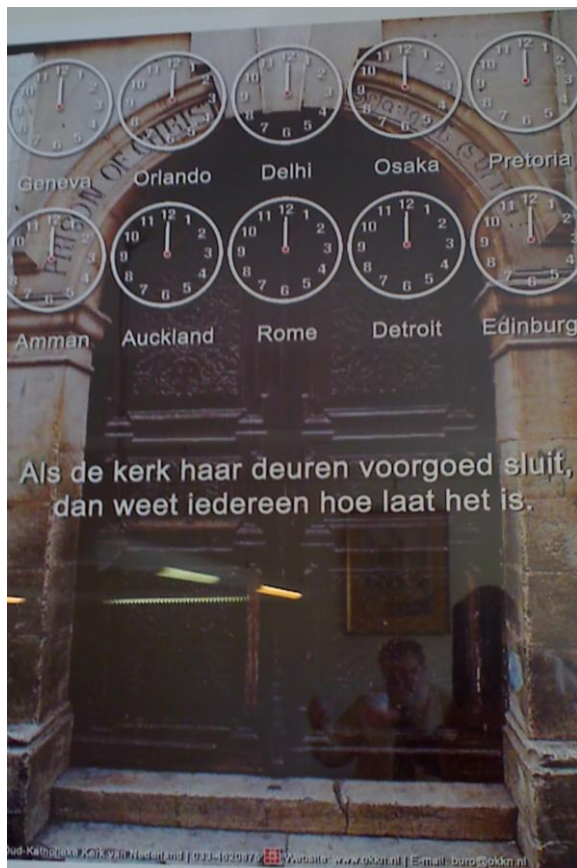
Poster, foto Margriet Gosker: Gebouw Raad van Kerken, Amersfoort