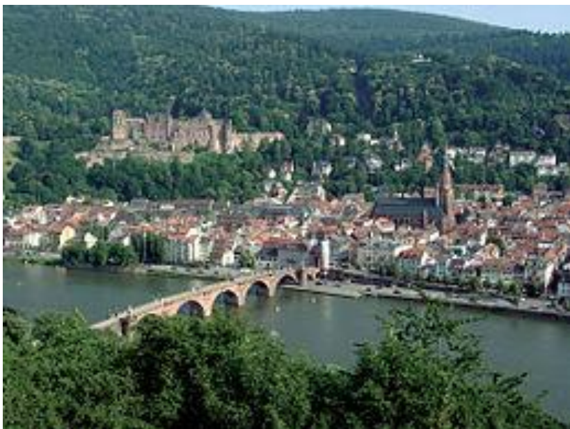
Zicht op Heidelberg

Reformator Philippus Melanchthon), Worms (van de Rijksdag), Frankenthal en natuurlijk ook Heidelberg zelf bezoeken.