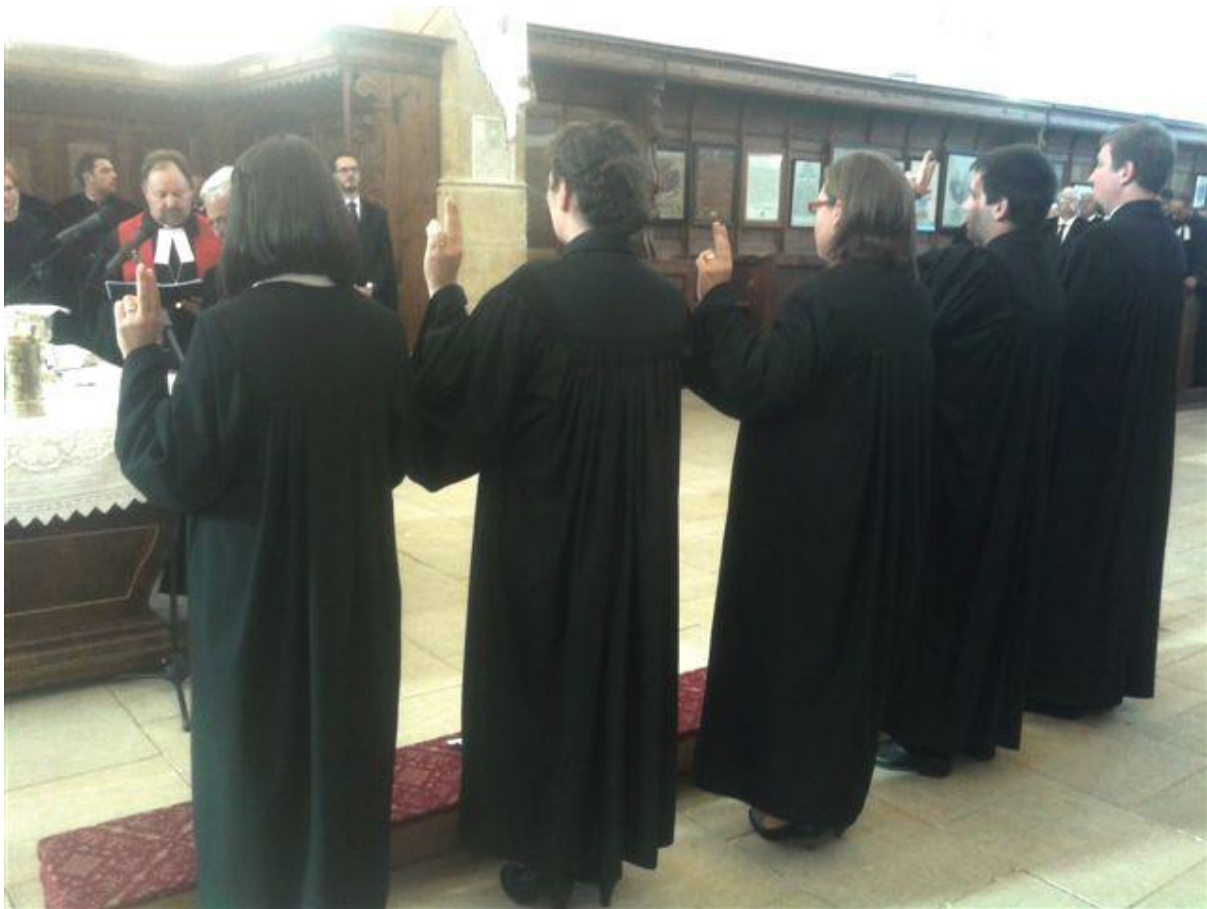
op de foto: de vijf lutherse geordineerden legen de gelofte af

spraken we na afloop uitvoeriger. Hij is gehuwd met een Nederlandse en woont op Urk. In de dienst werd een groetwoord gesproken door Ds. Christoph Sigrist (uit Zwitserland), die op het laatste moment nog was aangekomen. Na de ordinatie vierden we het heilig avondmaal met elkaar.