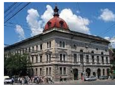
Protestants Theologisch Instituut