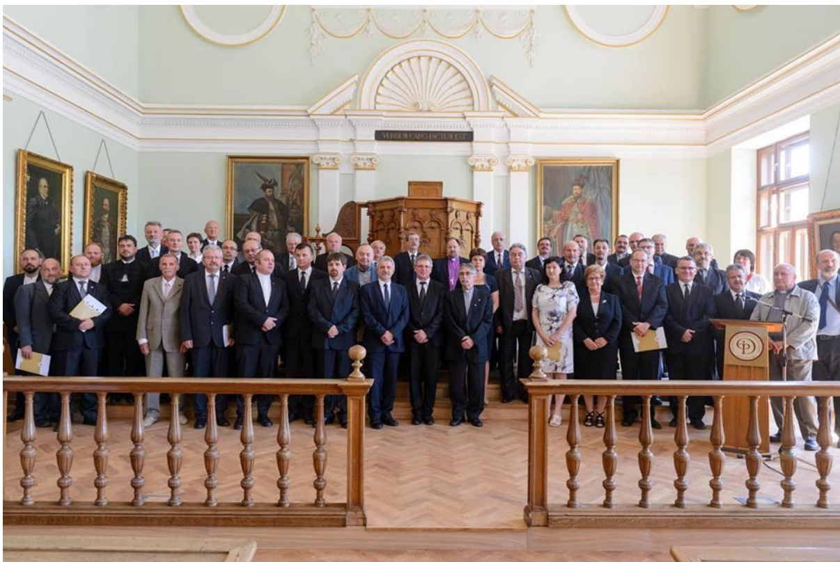
Foto van de gezamenlijke synode

The Lord is our powerful fortress, our protection and strength, everlasting praise and glory to Him alone